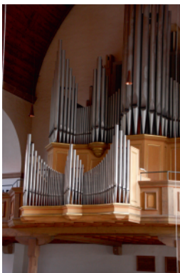
Orgel Friedenskirche

Sonntag, 13. Mai: „Der glückliche Prinz“ (Oscar Wilde); Pfrin. Renate Schauer und Karsten Leykam (Cembalo)