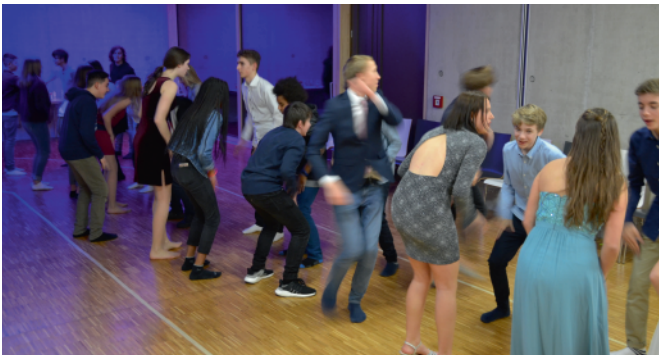
Spiel und Spaß in der Gruppe